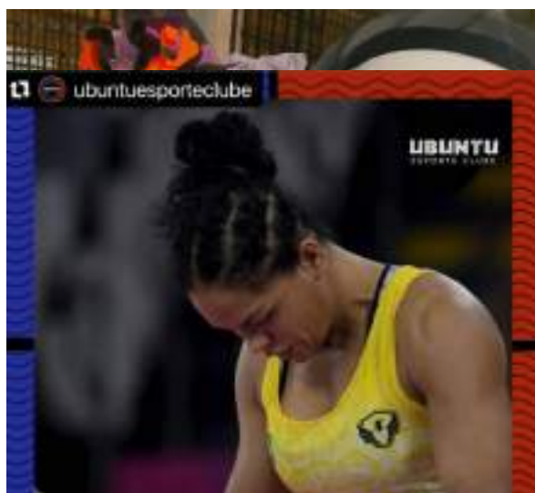
NOVEMBRO/21: Participação no episódio de podcast do Ubuntu Esporte Clube.