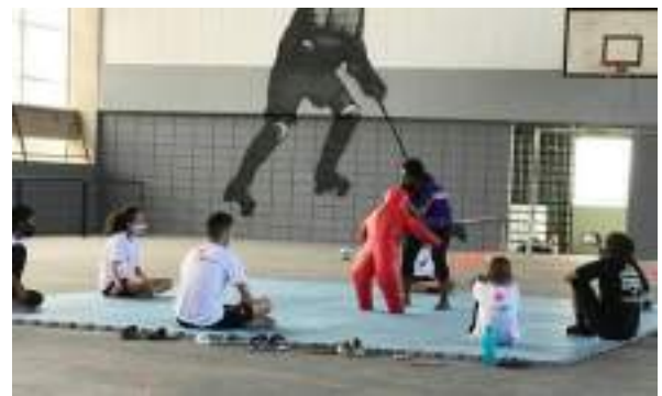
JUNHO/21: Aulas de wrestling.