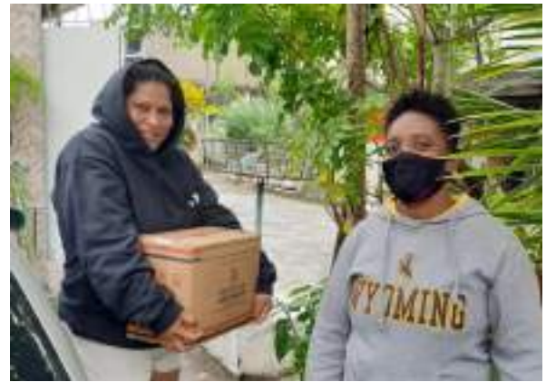
JUNHO/21: Entrega de cestas básicas.