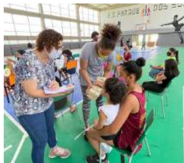
SETEMBRO/21: Ação Combate Á Pobreza Menstrual, dia de palestra, entrega de cartilha educativa e kit de absorventes.