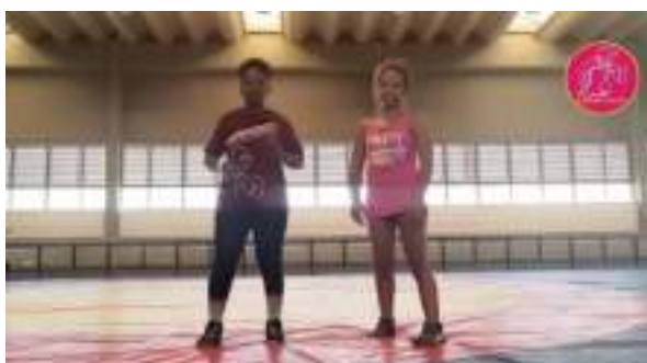
MARÇO/21: Aulas de Wrestling (online).