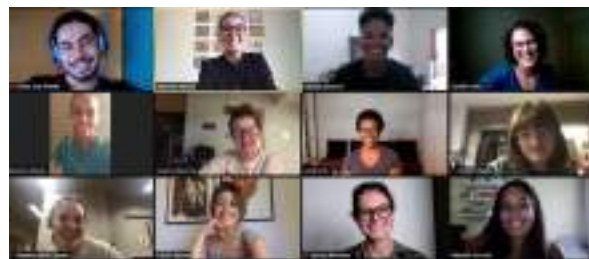
MARÇO/21: Reunião de alinhamento sobre o intercâmbio entre Estados Unidos e Brasil. VOLS BRAZIL (online).