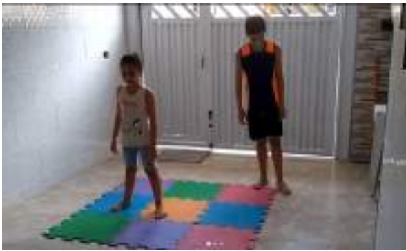
MARÇO/21: Treino para casa (online).