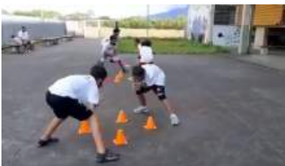
JULHO/21: Aula de Wrestling.