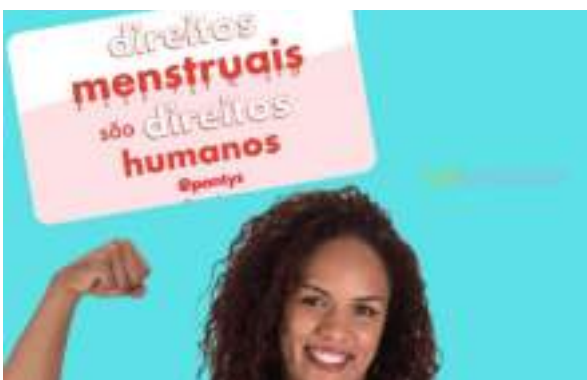
MAIO/21: Campanha de conscientização no Dia Internacional da Higiene Menstrual