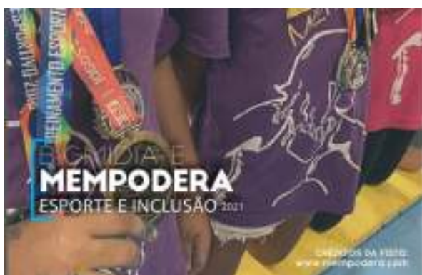
AGOSTO/21: Parceria BigMidia.