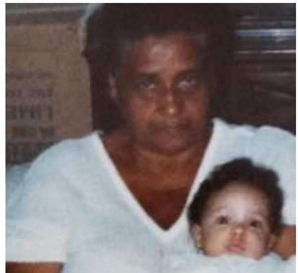
MAIO/21: Campanha dia das mães