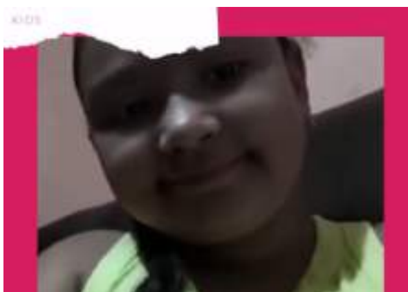
FEVEREIRO/21: Filme A Caminho da Lua