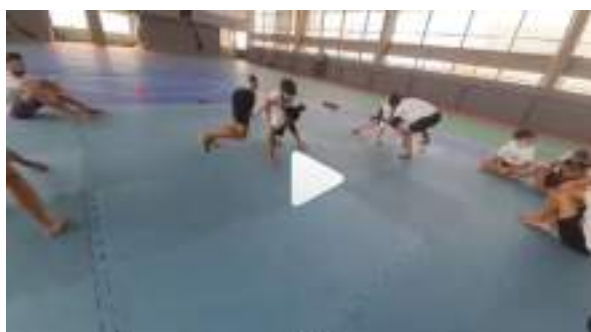
AGOSTO/21: Aulas Wrestling.