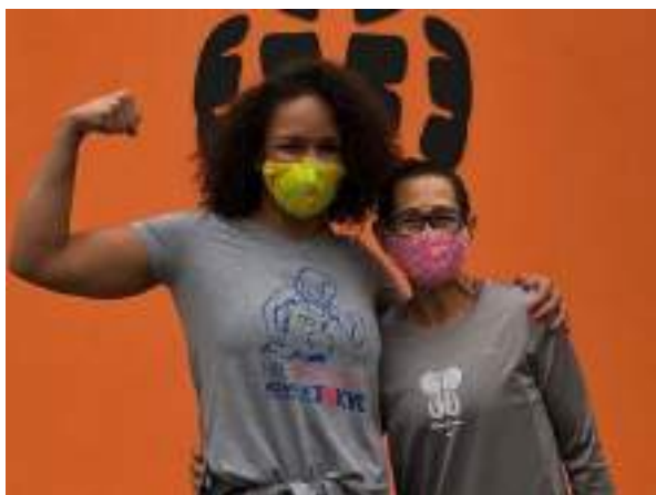
OUTUBRO/21: Visita ao Projeto Vida Corrida no Capão Redondo.