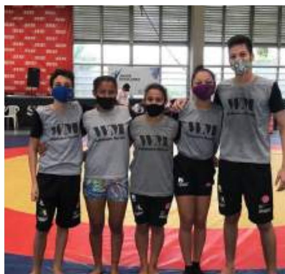
SETEMBRO/21: O time Mempodera na Seletiva dos Jogos Escolares de Wrestling - Etapa estadual.