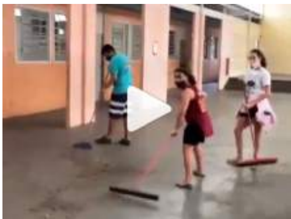
NOVEMBRO/21: Mutirão de limpeza na escola Martim Afonso.