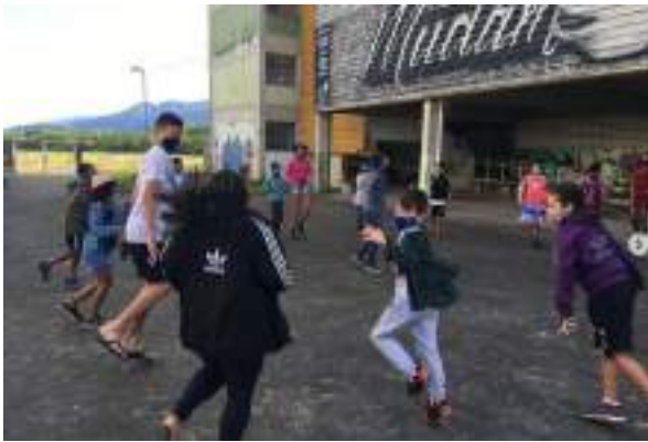
JUNHO/21: Festa Junina.