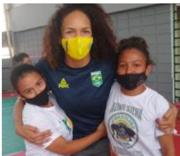
AGOSTO/21: Encontro com alunas.