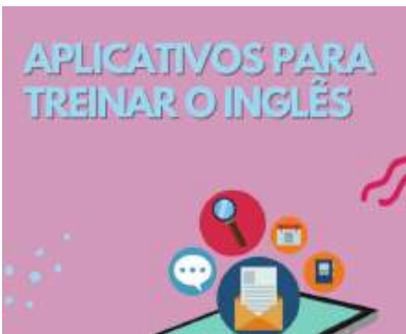
MARÇO/21: Dicas para inglês.