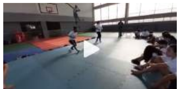
AGOSTO/21: Aulas Wrestling.