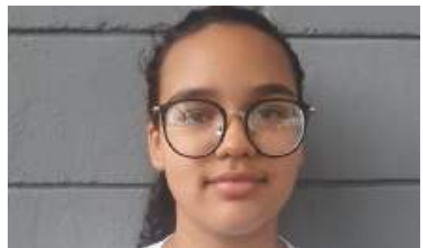
JUNHO/21: Novas alunas no projeto.