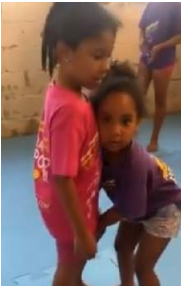
JULHO/21: Atividade com crianças.