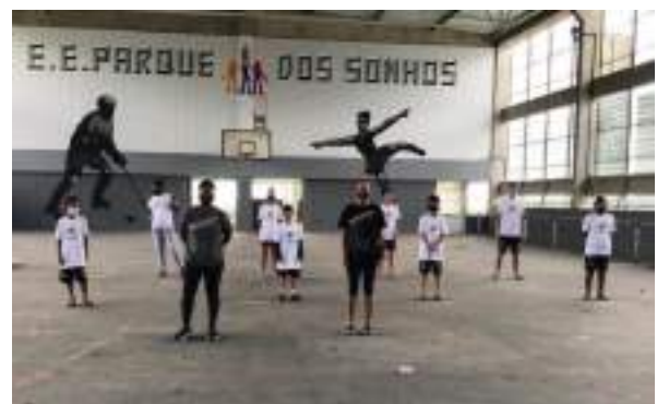
MAIO/21: Aos poucos voltando aos encontros presenciais, seguindo os protocolos de segurança - Covid19.