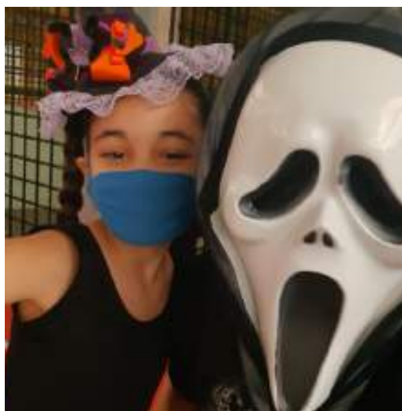
NOVEMBRO/21: Festa de Halloween.