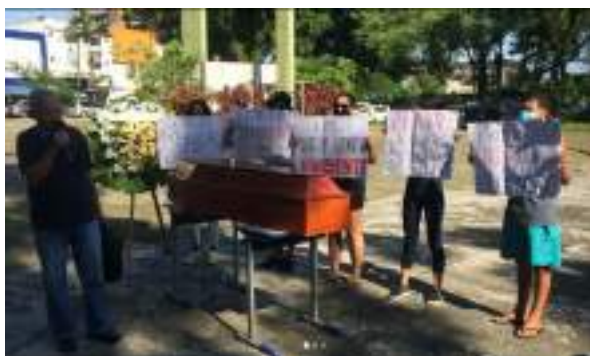
FEVEREIRO/21: Manifestação das famílias na escola Martim Afonso contra a demolição do prédio e exigindo um projeto de reconstrução do espaço.