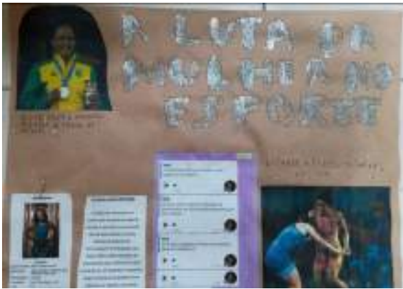
MAIO/21: Trabalho de escola de uma das alunas sobre a luta da mulher no esporte.