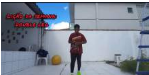
ABRIL/21: Dicas de treino (online)