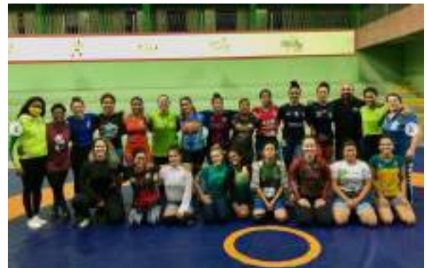
JULHO/21: Equipe no Camping feminino cadete e júnior, com palestras de nutricionista, psicóloga, biomecânica, doping e empoderamento!