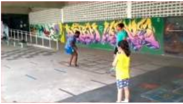
MARÇO/21: Aulas de Wrestling (online).