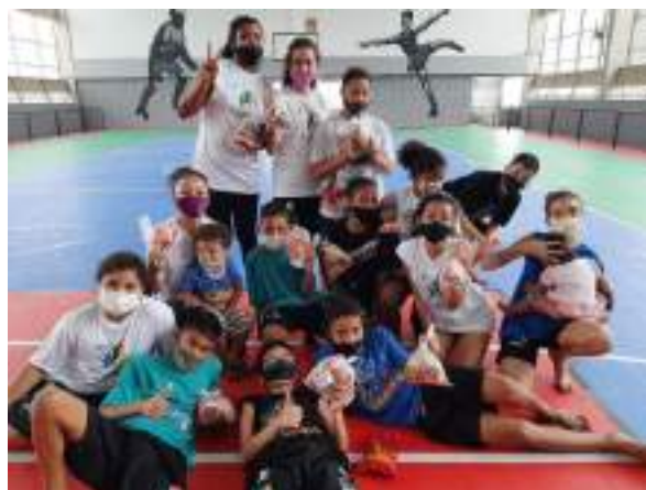
OUTUBRO/21: Atividade Dia das Crianças.