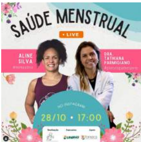
OUTUBRO/21: Live sobre saúde menstrual.