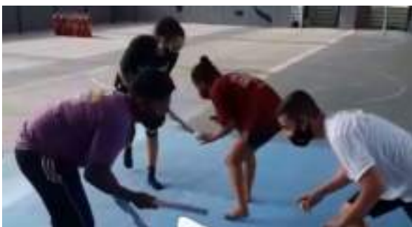
MAIO/21: Aulas de Wrestling.