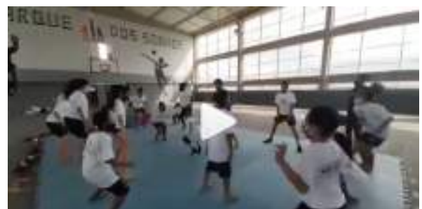
JUNHO/21: Aula de wrestling.