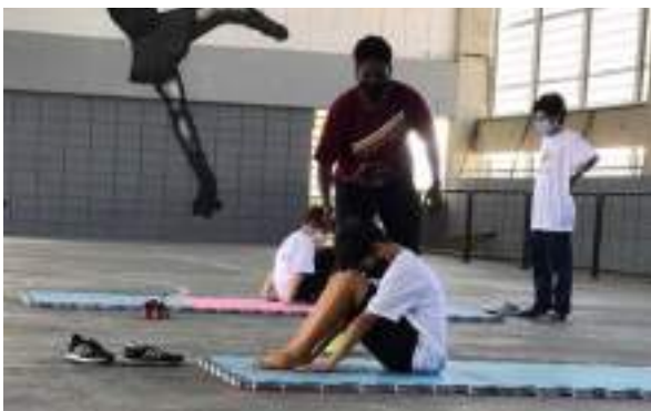
MAIO/21: Praticando ukemi.