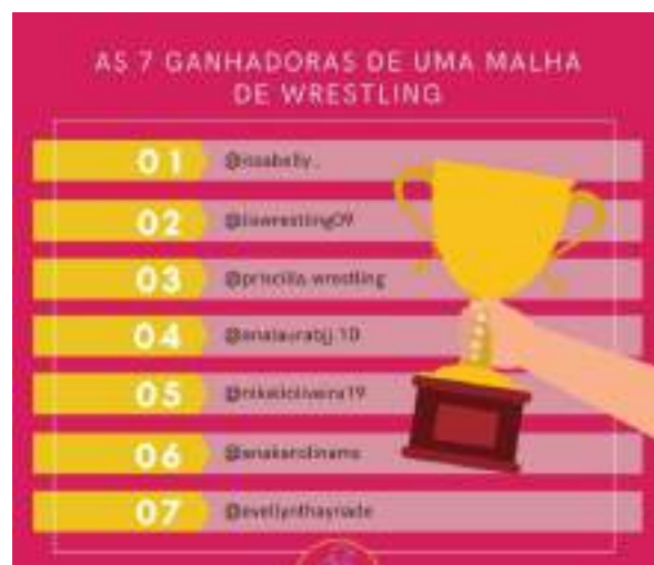
MARÇO/21: Destinação de malhas da Mempodera para 7 atletas. As peças foram adquiridas no Bazar e doadas para que atletas recebessem o material.