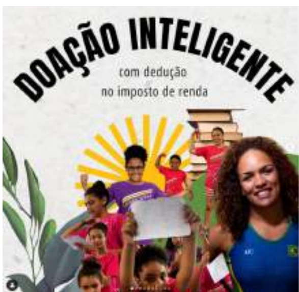
NOVEMBRO/21: Campanha para doação de IRPF - Doação inteligente - Projeto aprovado na Lei de Incentivo ao Esporte.