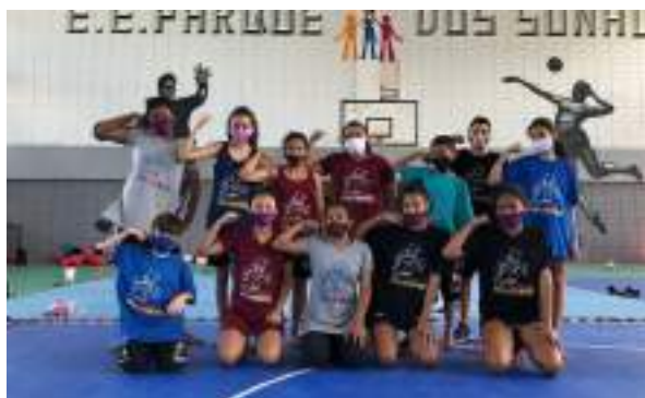
SETEMBRO/21: Equipe administrativa visitando o local de atividades.