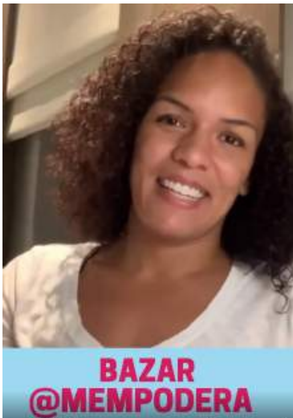
FEVEREIRO/21: Bazar Mempodera