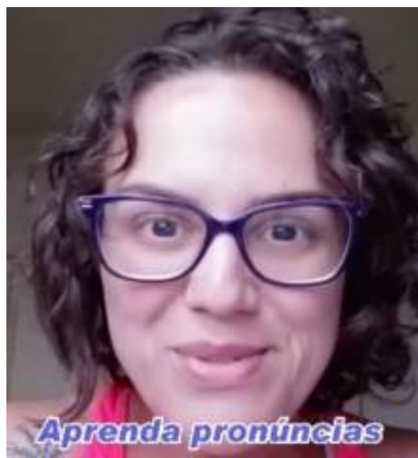
MARÇO/21: Aulas de inglês (online).